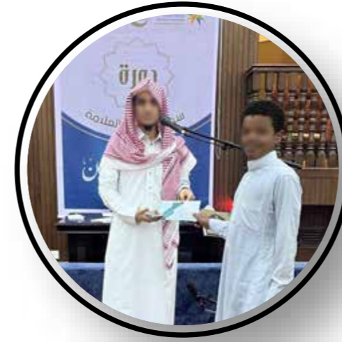
جامع الجوهرة بحي عيتقة