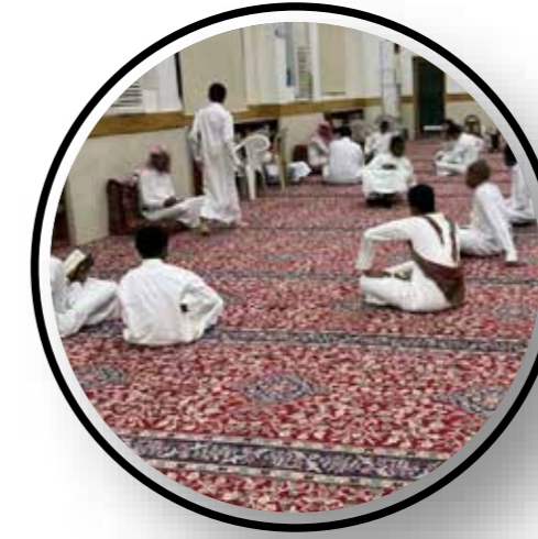
مسجد التويجري بحي منفوحة

الدورة القرآنية الرمضانية خلال رمضان المبارك بمشاركة 180 طالبًا