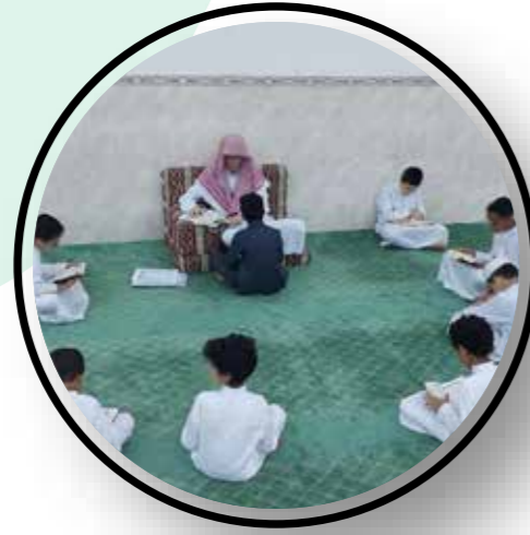
مسجد الخلفاء بحي اليمامة

المساجد والجوامع التي يرعى حلقاتها مجمع هيئة العبودي لتعليم القرآن الكريم وعلومه بجنوب مدينة الرياض: