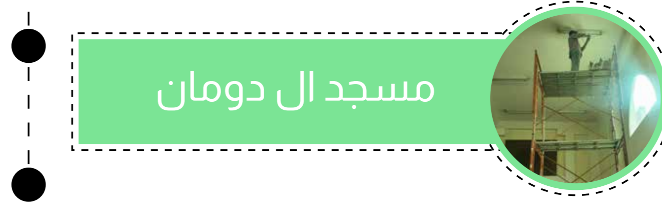
مسجد ال دومان