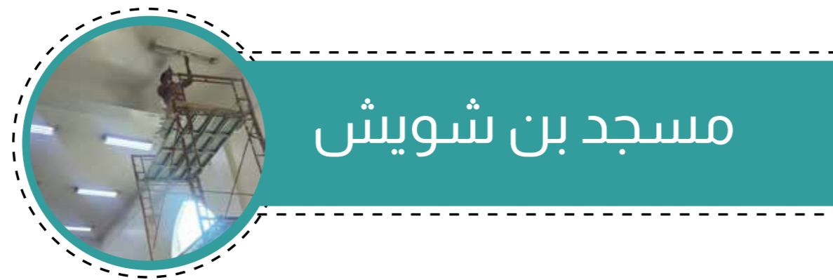
مسجد بن شويش

ساهمت مؤسسة هيئة العبودي الخيرية في صيانة العديد من المساجد وذلك بالتعاقد مع مؤسسة متخصصة في غسيل السجاد وكذلك صيانة التكييف وكذلك المياه والكهرباء وذلك للمساجد والجوامع التالية: